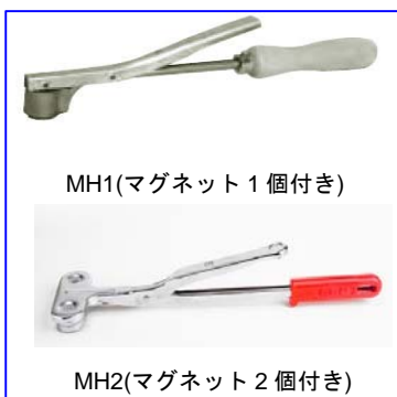
MH1(マグネット 1 個付き)